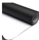
Tecido Matte White

A tela de projeção elétrica TES possui tecido de projeção Matte White (branco opaco), de verso preto, com ganho de brilho de 1,1 a 1,5 vezes. As bordas pretas no tecido permitem melhor enquadramento da imagem. Para limpeza da superfície, use água e sabão ou detergente neutro.